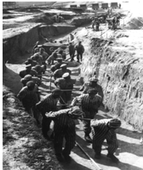
De granietgroeve van Mauthausen.

Hoe verschrikkelijk de toestanden in Mauthausen waren blijkt wel uit de bekentenis van kampcommandant Franz Ziereis die door de Amerikanen zwaar gewond werd toen hij probeerde te ontsnappen. Hij vertelde dat Himmler opdracht gaf om gevangenen met 45 kg graniet rondjes te laten rennen tot ze er bij neervielen en daarna werden doodgeschoten. Vermelding: ‘op de vlucht neergeschoten’.