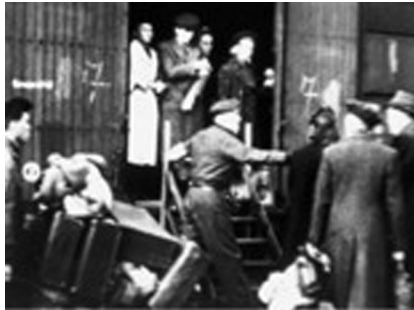
Joodse medeburgers worden weggevoerd.

Het is onbekend of zij via het bevolkingsregister of door verraad zijn gearresteerd. Wel bekend is, dat zij op 18 september 1942 in Westerbork werden ingeschreven waar ze twee dagen later vertrokken naar Auschwitz. Gertrude werd, evenals haar stiefzoon Kurt, omgebracht in Auschwitz op 24 september 1942. Het is onduidelijk waarom Franz niet meteen is vermoord. Waarschijnlijk heeft hij in een buitenkamp gewerkt of misschien zijn er medische experimenten op hem uitgevoerd. Hij overleed enkele maanden na zijn vrouw en zoon op 31 januari 1943.