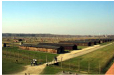
Overzicht Kamp Auschwitz-Birkenau