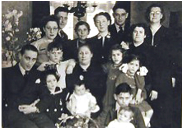
De families Cardozo en Abas