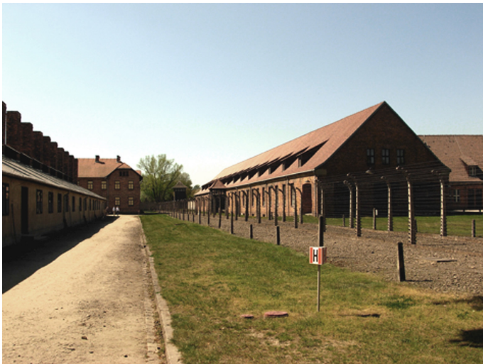
De barakken van Auschwitz I

Jozeph werd op 26 september 1870 geboren in Bonfeld. Hij en Aaltje Schlesinger–van der Hoeden, geboren op 4 oktober 1909 in Nijkerk werden in het Baarnse bevolkingsregister ingeschreven op 25 februari 1939. Beiden met de aantekening Nederlands-Israëlitisch. Ze trouwden op 14 maart 1939 in Baarn. Zoals verscheidene andere joodse Baarnaars vertrokken zij in 1942, waarschijnlijk onvrijwillig, naar Amsterdam. Van daaruit zijn ze naar kamp Vught getransporteerd. Van Vught kwamen zij op 29 september 1943 in Westerbork aan. Op 8 februari 1944 vertrok hun trein naar Auschwitz. Zoals zoveel anderen zijn ook zij kort na aankomst vermoord. Beiden kwamen daar op 11 februari 1944 om het leven.