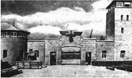
Toegang tot Concentratiekamp-Gedenkplaats Mauthausen