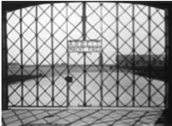
De beruchte poort van Dachau met de tekst “ARBEIT MACHT FREI”. Dit bord is in 2015 gestolen.