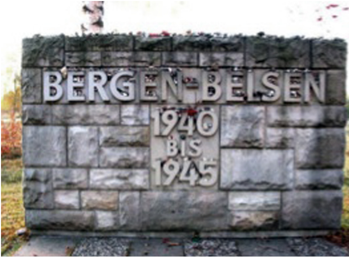
Gedenkteken voor het voormalige concentratiekamp Bergen-Belsen